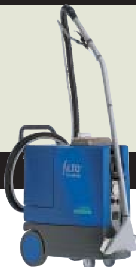
TW 1400 HD ▲