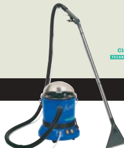
▲ TW 300 S