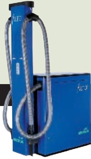
◀ SB TANDEM MARATHON ◀ SB TANDEM

Die rentable Investition: ALTO SB-Sauger • Bekannt für Zuverlässigkeit und starke Saugleistung • Saugdauer einstellbar • Langer Saugschlauch (4 m effektive Länge)