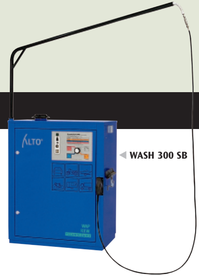
◀ WASH 300 SB