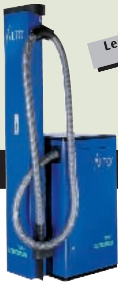
◀ SB STATION MARATHON ◀ SB STATION