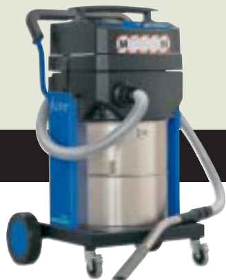
SQ 650-3M SQ 650-1M ▲