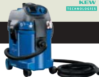
ATTIX 360-2M ▲