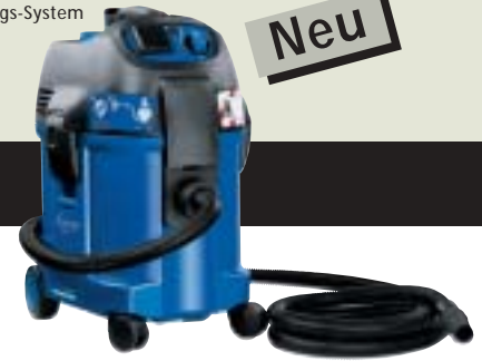
▲ ATTIX 360-2H Lieferbar ab Februar 2004 ▲ ATTIX 350-0H Lieferbar ab Februar 2004