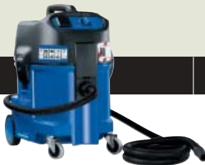
ATTIX 560-2M XC ▲ Lieferbar ab März 2004 ATTIX 550-2M Lieferbar ab Februar 2004