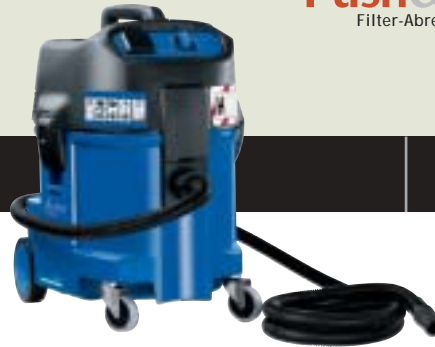
▲ ATTIX 560-2H XC Lieferbar ab März 2004 ▲ ATTIX 550-2H Lieferbar ab Februar 2004 ▲ ATTIX 550-0H Lieferbar ab Februar 2004