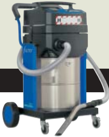
▲ SQ 650-3H ▲ SQ 650-1H